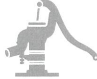
農業用の井戸・水道