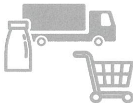
加工・流通・販売